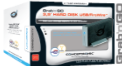
Grab'n'GO 3,5" HARD DISK USB/FireWire™