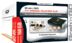
Grab'n'GO TV MEDIA PLAYER 3,5"